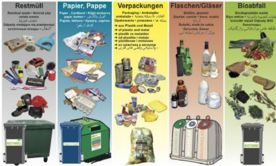
这样的垃圾分类宣传图，德国网上一抓一大把

德国人向来以守秩序著称，不仅是上班族，老老小小都随身带着自己的秩序手册，每一个日程安排都清清楚楚。而垃圾也同样有垃圾日历，在德国居住都少不了它。垃圾日历是每个地方市政给居民发放的本年度垃圾清运时间安排表，发放到每一户，也可以在网上传询或下载。笔者查看了自己住过的达姆施塔特榉原路今年的垃圾日历，纸质版正面是这样的（反面是下半年）：