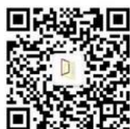
同济大学德国研究中心