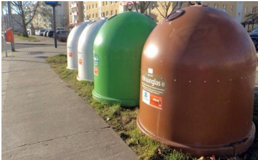
玻璃瓶集中投放点

把视线投回到上海，来看看目前上海在推行垃圾分类过程中市民比较有争议的几个问题。一个细节问题就是，根据上海的规定，投放的时候要把湿垃圾倒进湿垃圾桶，再把装湿垃圾用过的塑料袋投放到干垃圾桶，但这个操作的体验较差。德国的生物垃圾可以包在报纸中丢弃，超市里也出售可降解的生物垃圾专用袋。我们投放湿垃圾如果允许带有类似包装，不仅舒适度和可操作性大大提高，也可能减少湿垃圾桶的污水和馊味。当然，现在上海也出现了湿垃圾的“破袋神器”，也有垃圾分类专家表示，可降解的生物垃圾专用袋首先要与后端处理相结合，否则不易大规模推广。