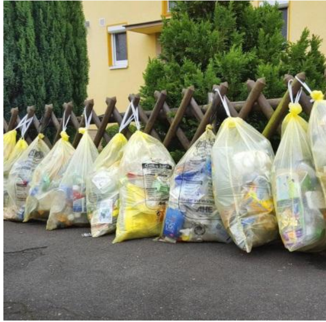
黄色垃圾袋（可回收包装物）回收日的街头一景，很德国